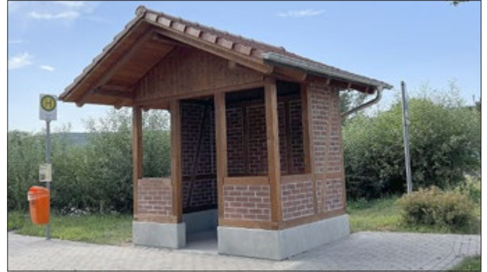
Cordula Wiegand Feuerwehr- und Kulturverein Lausnitz e.V

Die Lausitzer bedanken sich ganz herzlich bei der Gemeinde Unterwellenborn. Das kleine Bauwerk steht für eine durchaus nicht überall gelebte Bürgernähe.