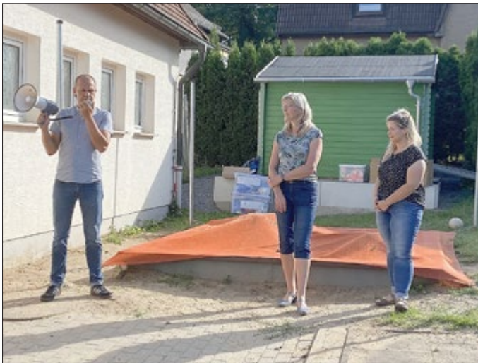
Das Pädagogen-Team der Grundschule Könitz

An dieser Stelle möchten wir dem Förderverein für die unermüdliche Arbeit und Unterstützung danken! Ohne Euch wären viele Dinge nicht realisierbar.