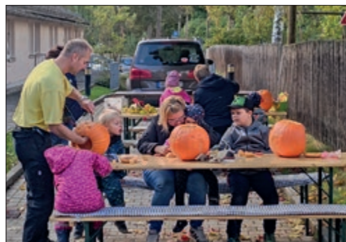
Beim Kürbisschnitzen beobachtet.

So neigte sich der schöne Nachmittag dem Ende zu und jeder Gast war zufrieden und sehr dankbar für diese Veranstaltung.