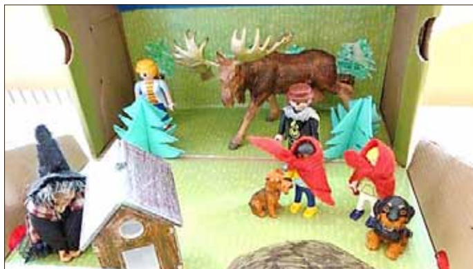
„Der Hirsch mit dem goldenen Geweih“