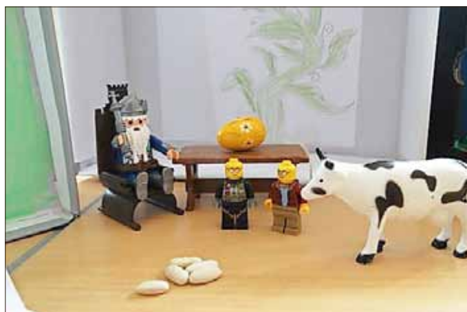
Märchenkiste „Die Zauberbohne“