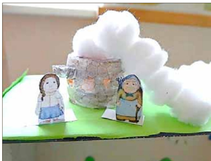
Das Märchen „Vom süßen Brei“