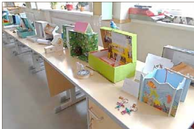
Ausstellung im Klassenraum

...und wenn sie nicht gestorben sind, dann lesen sie noch immer in ihren Märchenbüchern!