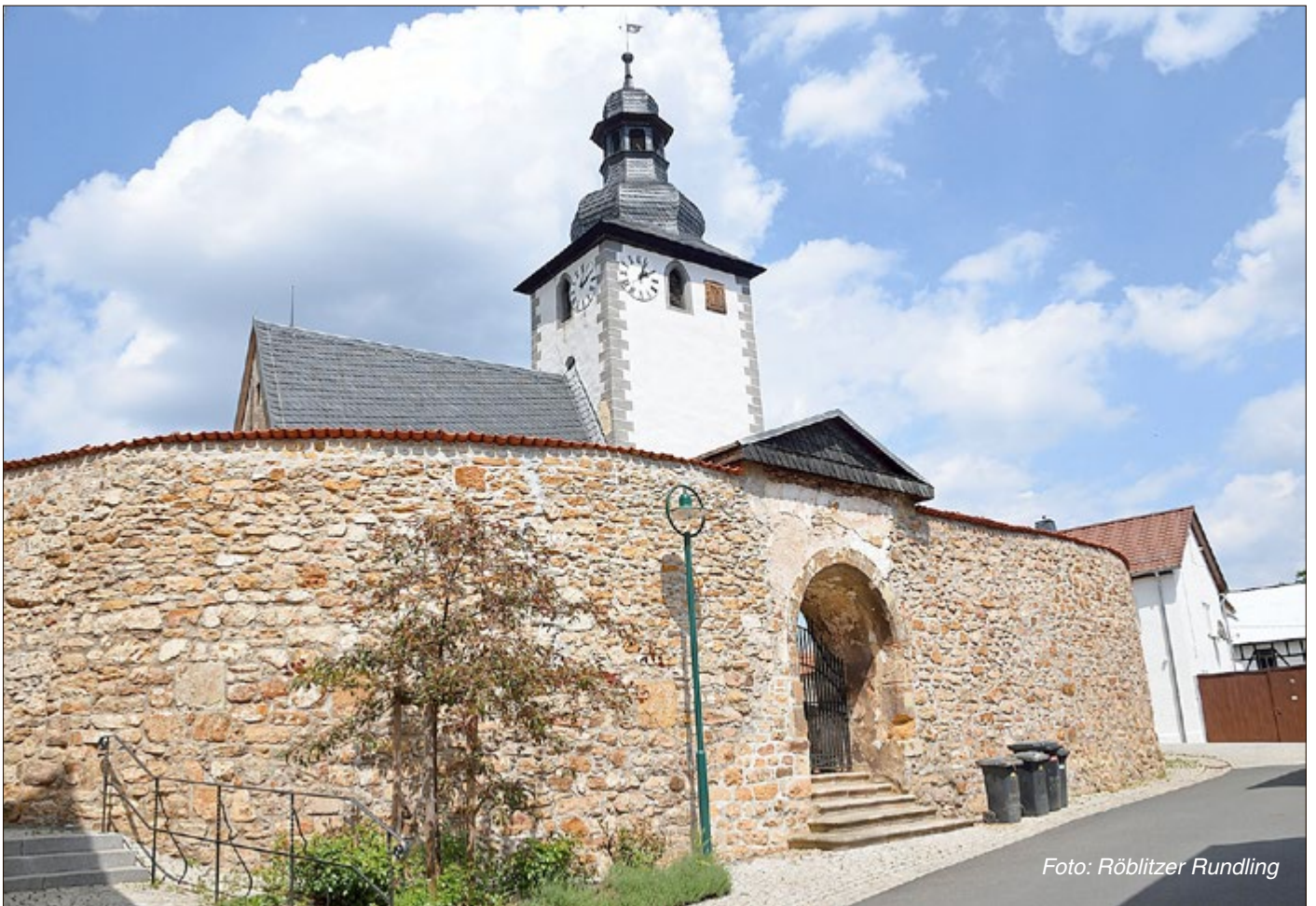
Foto: Röblitzer Rundling