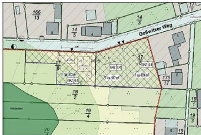
Stand August 2020 (ohne Maßstab) Unterwellenborn, den 17.11.2020