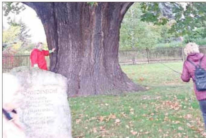
Ein herzliches „Frisch auf“ Jüren Wenig Wanderleiter

Alle freuen sich nun schon auf die Wanderung am 7. November 2019 an die kleine Talsperre Zeulenroda.