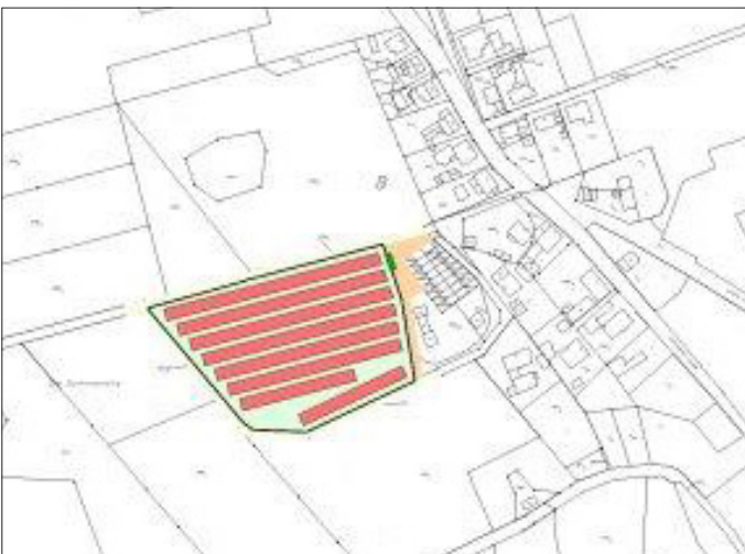
Entwurf, Stand März 2019 (Planauszug, unmaßstäblich)

Der Entwurf des Bebauungsplanes „Errichtung einer Photovoltaikanlage im OT Goßwitz“ liegt