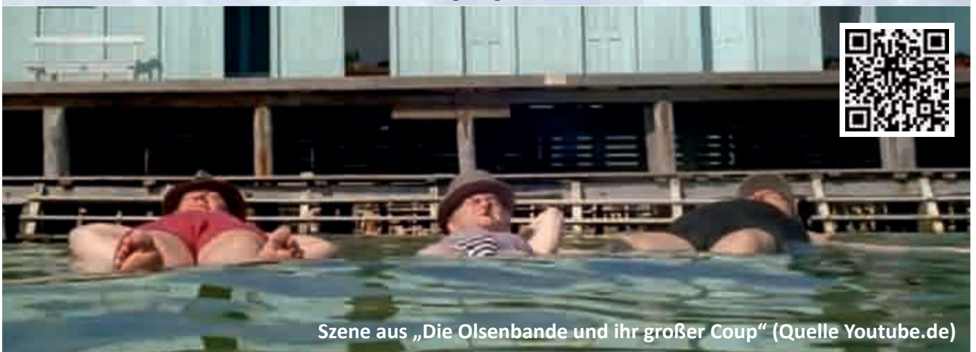
Scene aus „Die Olsenbande und ihr großer Coup“

Per virtuellem Rundgang kann in den Geschädigten (Kulturpalast) eingesehen werden. Decke für die Wiese und Snacks dürfen auch mitgebracht werden, die Verhandlung könnte dauern. Für Getränke ist gesorgt.