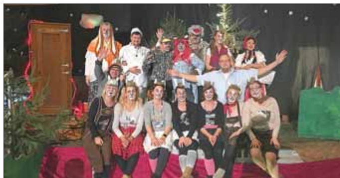
Die Märchenspielgruppe der Kindertagesstätte Kamsdorf

Dank vieler fleißiger Helfer, eingegangener Geldspenden und natürlich den zahlreichen Besuchern wurde die nunmehr bereits 19. Aufführung des Kamsdorfer Märchenensembles wieder ein großer Erfolg. Der Erlös wird wie immer der Kindertagesstätte zur Verfügung gestellt, um Spielsachen für die Kinder anzuschaffen.