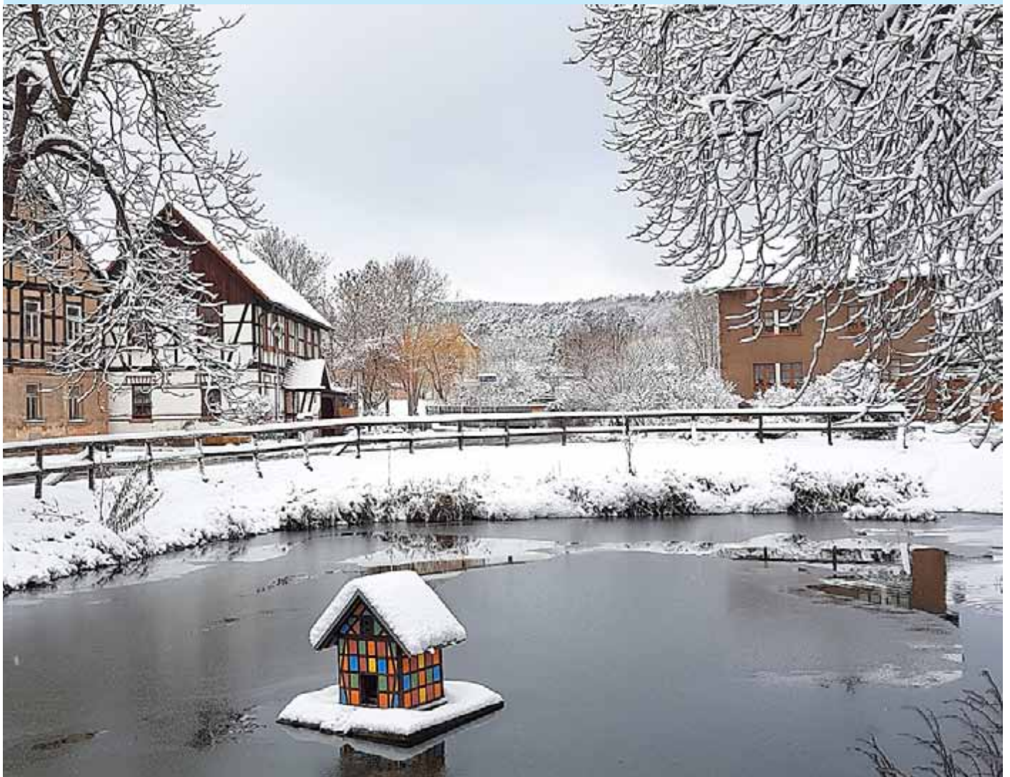
Foto: Dorfteich in Röblitz