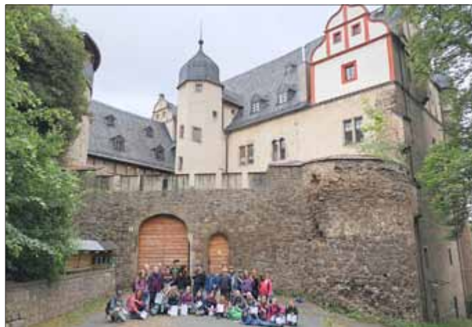
Die Klassenlehrer der 3/4a und 3/4b

„Der Sinn des Reisens ist es, an ein Ziel zu kommen, der Sinn des Wanderns ist es, unterwegs zu sein.“ (Theodor Heuss) Und wir waren unterwegs! Denn am Freitag, den 18.05.18 hatten die Klassen 3/4 a und 3/4 b einen gemeinsamen Wandertag. Ausgerüstet mit Rucksack, Stift, Karte und einem Kompass mussten sich die Kinder durch ihren Heimort navigieren. Während der Wanderung erfüllten sie eine Vielzahl von Aufgaben und mussten zusätzlich ihre zurückgelegte Strecke und besondere Gebäude in die Karte einzeichnen. Es war ein toller und abwechslungsreicher Tag und den Kindern hat die Arbeit mit der Karte und dem Kompass viel Freude bereitet.