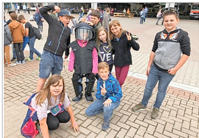
Klasse 4 der Friedrich-Herthum-Grundschule Könitz

Am Mittwoch, den 16.05.2018 lud die Kombus GmbH Saalfeld wieder zum alljährlichen Verkehrssicherheitstag die 4. Klassen der Grundschulen im Landkreis Saalfeld-Rudolstadt ein. Auch die Klasse 4 der Friedrich-Herthum-Grundschule nahm diese Einladung an. Die Schüler konnten auf dem Gelände der Kombus GmbH viele verschiedene Dinge zur Verkehrssicherheit praktisch erproben bzw. Vorführungen live erleben. Sie erfuhren z.B. etwas über die Arbeit von Motorradpolizisten. Sie lernten den toten Winkel von Bussen kennen und warum es wichtig ist, sich beim Autofahren anzuschallen. Ebenso erklärten die Feuerwehr, die Bundespolizei und der Rettungsdienst seine Aufgaben. Abgerundet wurde die Veranstaltung durch einen gestellten Rettungseinsatz auf dem Gelände. Die Schüler hatten alle sichtlich Spaß, diese Dinge praktisch zu erleben. von D.Schubert