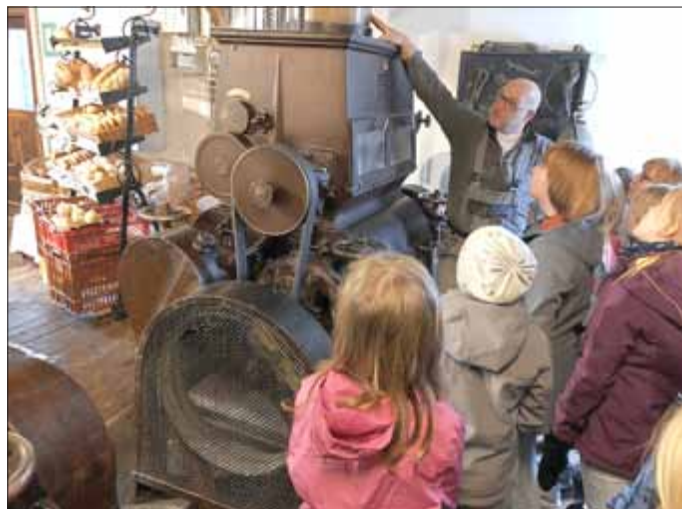
Die Kinder der dritten Klassenstufe der Friedrich-Herthum-Grundschule Könitz

Am Montag, dem 16.04.2018, besuchte die Klasse 3 der Friedrich-Herthum-Grundschule Könitz, unter dem Motto „Vom Korn zum Brot“, die Nestlermühle in Schwarzza. Dort lernten die Schüler den Verarbeitungsprozess vom Getreide hin zum Mehl praktisch kennen. Sie erhielten einen detaillierten Einblick in alle Verarbeitungsprozesse in einer Mühle. Dabei staunten die Schüler nicht schlecht, als sie die Ausmaße, dieser eigentlich ziemlich versteckten Mühle, im Inneren des Gebäudes sahen. Die Schüler der Grundschule bedanken sich recht herzlich beim Team der Nestlermühle für diese interessanten Einblicke und das neue Wissen.