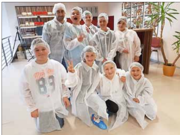
Die Kinder der vierten Klassenstufe der Friedrich-Herthum-Grundschule Könitz