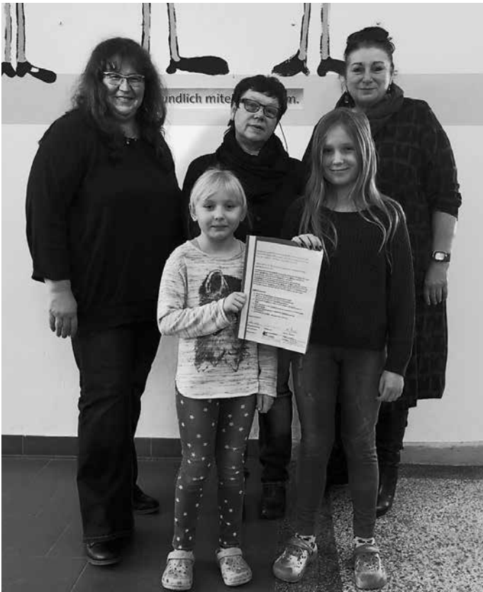
Unterzeichnung des Kooperationsvertrages

Dieser sieht u.a. die Umsetzung folgender gemeinsamer Inhalte vor: