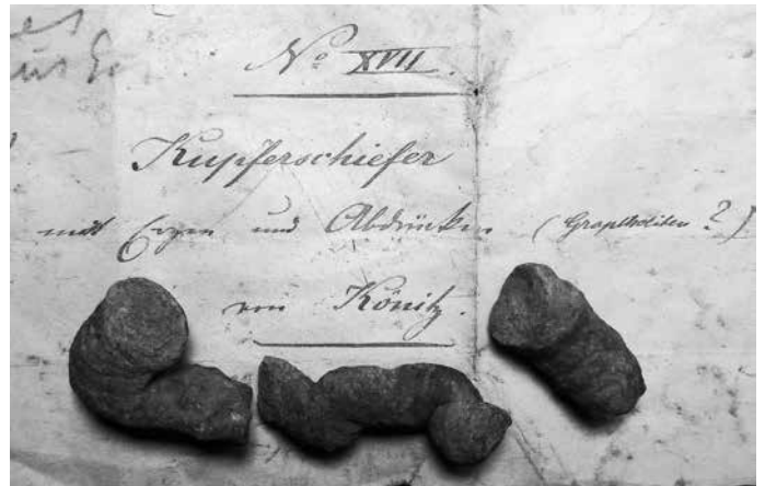
Lebensspuren, historischer Fund um 1845 – 1860

Fossilien sind die Überreste von Pflanzen und Tieren aus weit zurückliegenden Zeiten der Erdgeschichte.