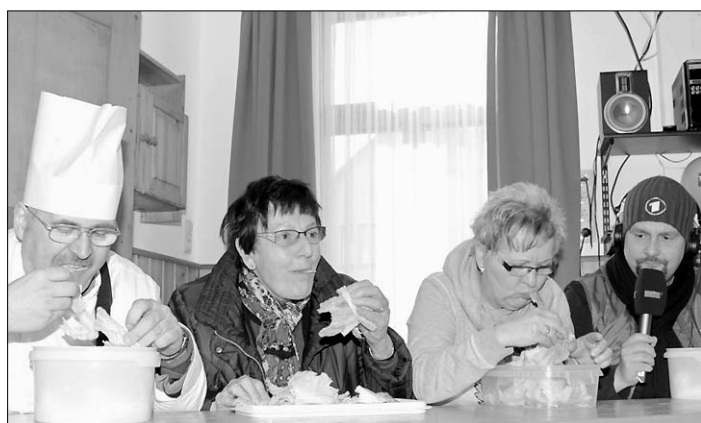
Man stopfte eifrig in den Schlund hinein, denn Salat kann doch so köstlich sein.