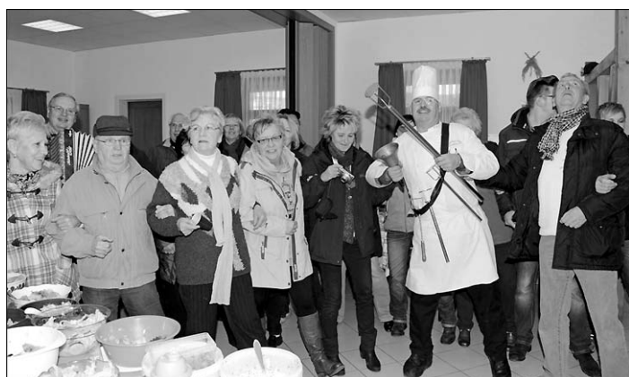
Gute Laune und Heiterkeit waren angesagt während der ganze Zeit.