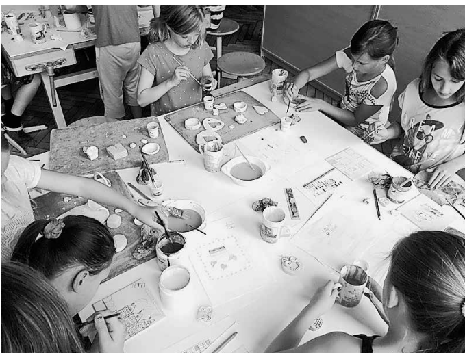
Kinder beim Bemalen der Tonfliesen