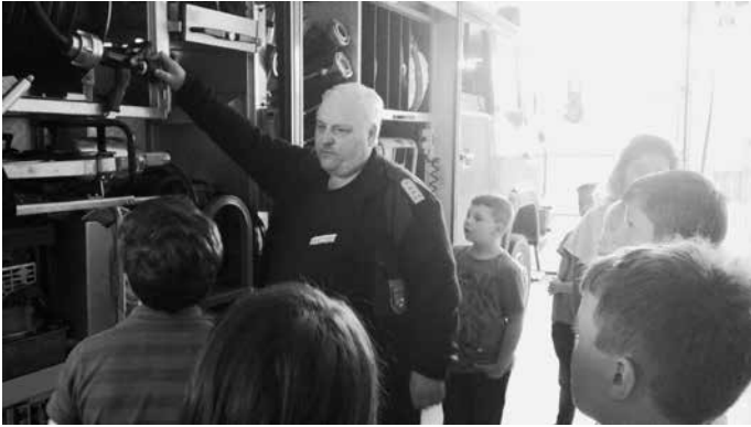
Kinder lauschen den Erläuterungen.

Feuerwehr und ihrer Geschichte hier in Könitz sowie über Berufsfeuerwehren kennen. Neben allen Interviewfragen, die die Kinder vorbereitet hatten und die von den Feuerwehrleuten ausführlich beantwortet wurden, lernten wir viel über Feuerwehrfahrzeuge und die Einsätze der Freiwilligen Feuerwehr kennen, konnten vorhandenes Wissen auffrischen und viele neue Informationen mitnehmen.