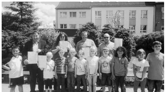
Unsere Kooperationspartner mit unterschriebenem Vertrag