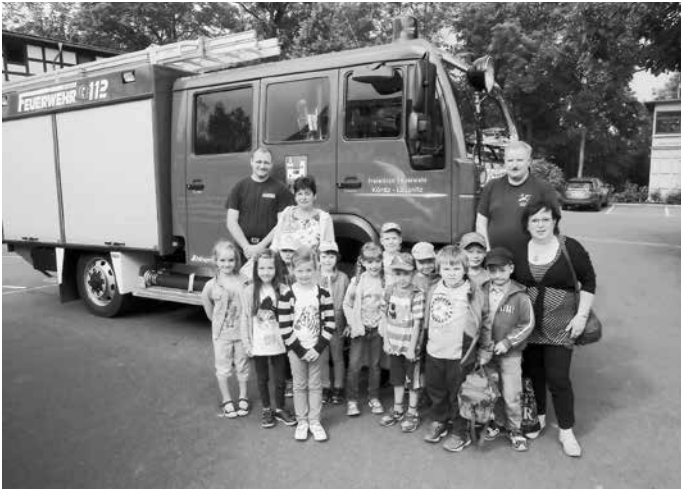
Das Team vom Kindergarten „Pffifikus“

Weiterhin möchte sich das Team vom AWO-Kindergarten „Pffifikus“ Könitz auf diesem Weg recht herzlich bei der Freiwilligen Feuerwehr Könitz für die jahrelange gute Zusammenarbeit und die Unterstützung bei Festen und Feiern bedanken.