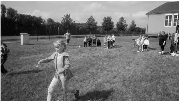
Kinder bei den Staffelwettkämpfen

Am 09.06.2016 war es wieder so weit. Die Staatliche Grundschule Könitz und der Kindergarten Bucha feierten gemeinsam das diesjährige Sportfest auf dem Sportplatz der Regelschule Unterwellenborn.